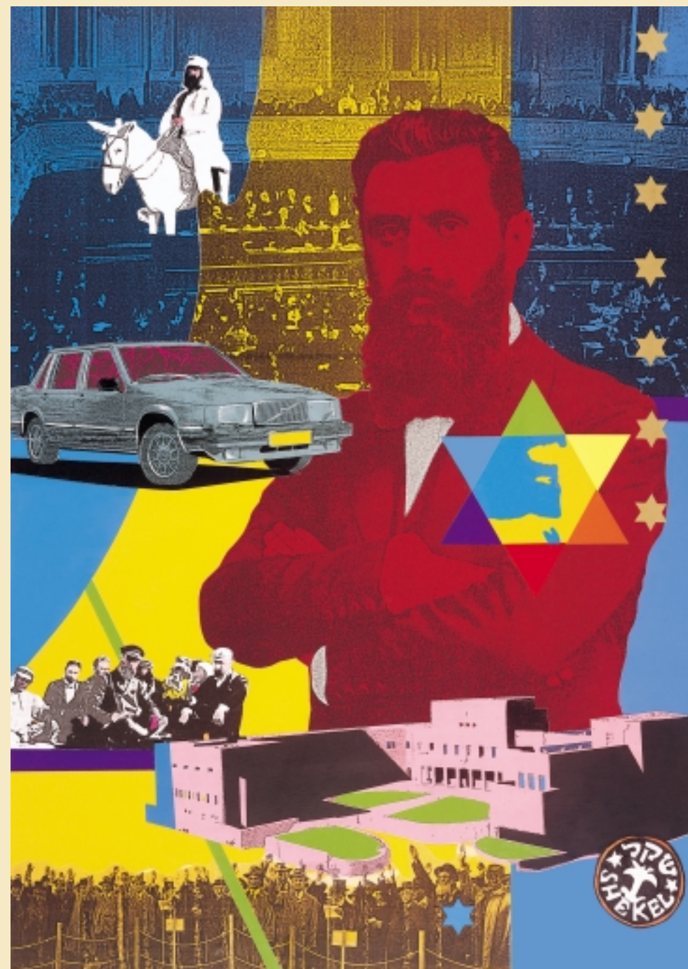
זוד טרטקובר, מתוך: ההכרזה על הקמת המדינה, 1988, קולאז' על נייר, 70x60 ס"מ, אוסף האמן

שעות פתיחה: ימים א'-ה': 8:30-17:45, יום ו': 8:30-13:00